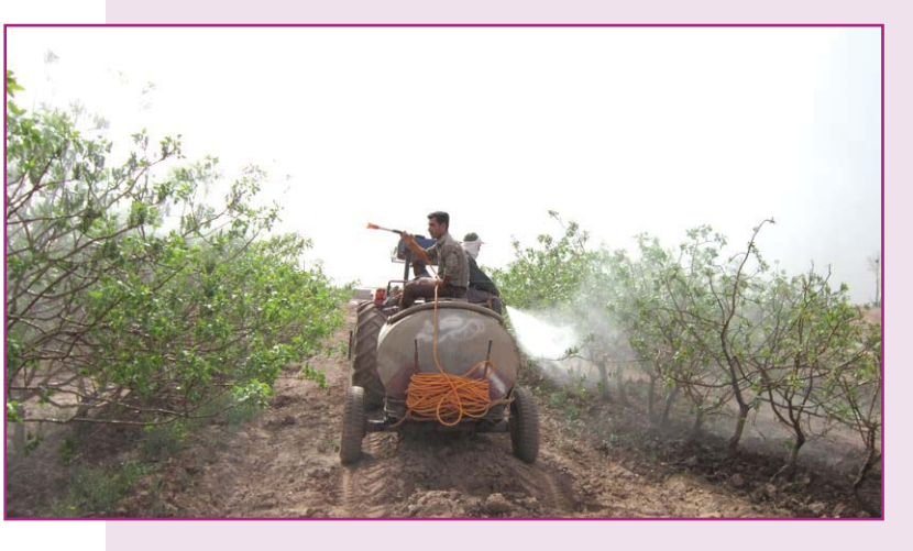
و دوم آیا می شود این مشکل را به فرصت تبدیل کرد؟

البته شکی نیست خرد بودن مالکیت مشکلات و مسائل خود را دارد و هر تلاشی که برای تجمیع مالکیت انجام شود لابد مفید خواهد بود. هر تلاشی که بوده امروز خرده ملکی واقعیت باغداری پسته در رفسنجان است. قطعاً بدون توجه به این واقعیت نمی توان از کشاورزی پسته در رفسنجان تعریف درستی به دست داد. سوال اول ما باید این باشد که چطور باید با این واقعیت کنار آمد