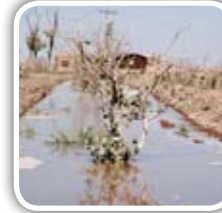
پیگیری مصوبات ستاد عالی پسته