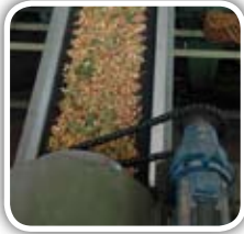
پسته ایران در رتبه ۲ صادرات