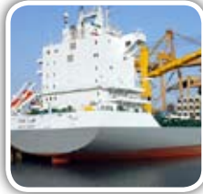
شرایط نمونه گیری از محمولات وارداتی پسته ایران به اروپا