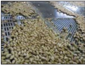
پسته کرمان برای نخستین بار هر کیلو ۸ دلار فروخته شد