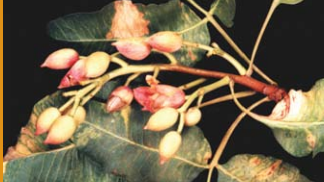
تشکیل میوه روی شاخه سال جاری در اثر عدم تأمین نیاز سرمایی

در ادامه مطلب مندرج در خبرنامه شماره ۴۵، قسمت دوم مجموعه عملیات زمستانه لازم الاجراء در باغهای پسته؛ مشتمل بر «کاشت و تکثیر پسته» و «مدیریت آفات در زمستان» را در این شماره می‌خوانید: